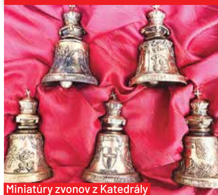
Miniatúry zvonov z Katedrály sv. Martina v Bratislave