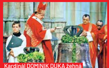
Kardínal DOMINIK DUKA žehná zvony v pražskej katedrále

Kresťanská legenda hovorí, že keď v roku 406 n. l. išiel biskup Paulinus z talianskej Kampánie lesom, upútala ho kvetina v tvare zvončeka. A vtedy sa aj zrodila myšlienka zhotoviť zvony kovové. Tie potom ako roľnícky zdobili odev alebo sa stali súčasťou šperkov. K prvým zvonárom patrili mnísi. Jeden z nich, mních Theophilus, v roku 1160 opísal postup výroby zvonov a bol vyhlásený za vynálezcu metódy ich výroby. Do tohto obdobia spadá i začiatok českého zvonárstva. O veľkých zvonoch, slúžiacich cirkevným účelom, sú zmienky z konca 6. storočia. História zvonárstva siaha až do 15. storočia, keď dostáva zvon klasický hrúškovitý tvar.