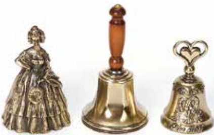
Vyrábajú aj rozličné menšie zvončeky, ktoré si môžete zakúpiť u nich na vianočných trhoch

Zvony Dytrychovcov visia v Katedrále sv. Víta, Václava a Vojtěcha v Prahe, tiež v Olomouci – v Katedrále sv. Michala, v Brne. Avšak najväčší zvon, ktorý ich