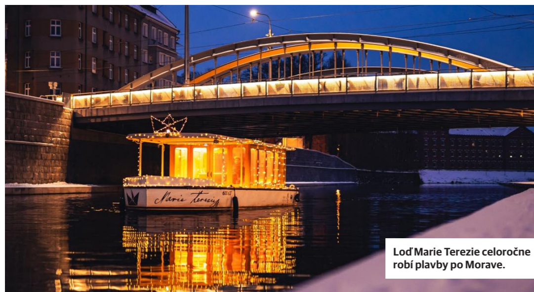
Loď Marie Terezie celoročne robí plavby po Morave.