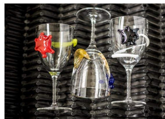
Minimalistické návrhy Milana Knížák zrealizované v skle vystavujú v Slovenskom sklárskom múzeu v Lednických Rovniach.

bí Knížák navrhol pre Moser niekoľko výnimočných objektov a keď som ho oslovil, neváhal, pripravil si niekoľko projektov a na sympóziu prišiel. Odvtedy sa stretávame vždy, keď som v Prahe.