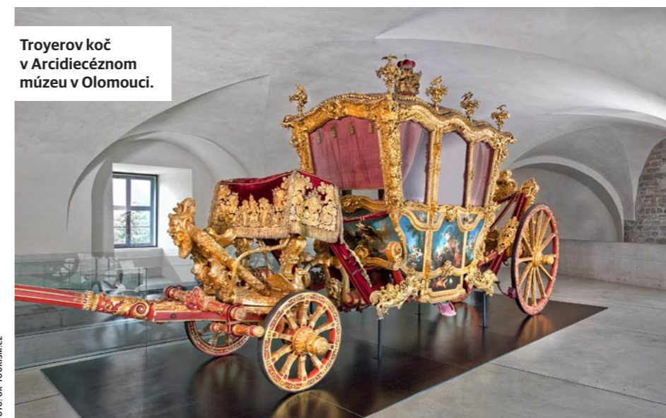
Troyerov koč v Arcidiecéznom múzeu v Olomouci.