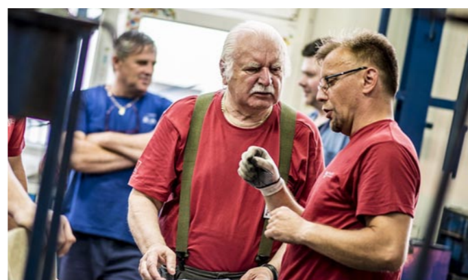
Milan Knížák so sklármi.

u nás. No výstav máva veľa, čo pre neho znamená táto? Je niečím zvláštna? Milan Knížák mal vo svojom živote naozaj obrovské množstvo výstav, ale myslím si, že pre neho bolo naozaj radostné, že sme do skla zrealizovali jeho staré návrhy. Bol nadšený, keď som mu tieto veci priniesol. A sú naozaj zaujímavé - nadčasové a (na Knížáka) prekvapujúco minimalistické. Vy ste sa na prípravu výstavy podieľali kurátorsky aj architektonickým riešením. Nemal námietky? Poznáte sa s umelcom dobre? Zdá sa dosť neprístupný a je aj obľetovaný. Čo vás dalo dokopy?